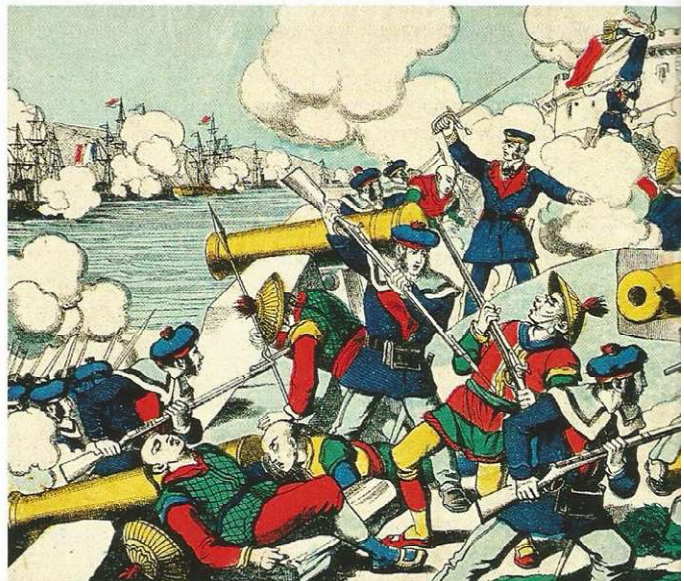
Imagerie Pellerin, fin XIX e siècle.

En 1883, les Français s'emparent du port de Hué et l'empereur d'Annam reconnaît le protectorat de la France sur l'Annam et le Tonkin. Mais il faut attendre 1885 pour que le protectorat soit totalement accepté.