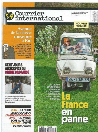
Couverture de l'hebdomadaire Courrier International du 10 au 17 octobre 2012.