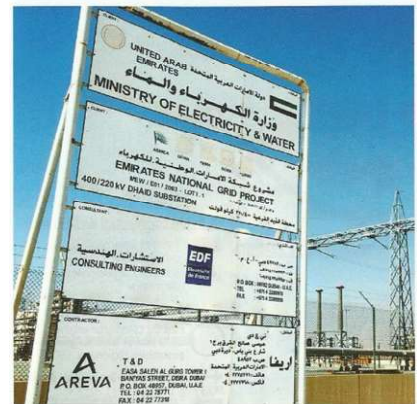
EDF et Areva, leaders mondiaux dans les domaines de l'énergie, construisent des centrales électriques dans de nombreux pays, comme ici à Dubaï (Émirats arabes unis).