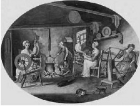
Doc.1 : Fileuses de lin, W. Hinks, 1783