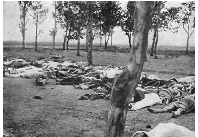
Photographie prise par Henry Morgenthau, ambassadeur américain, de victimes arméniennes

Question 1 : Que reproche le gouvernement ottoman à la communauté arménienne (doc.1) ? Quelles mesures prend-il ? (doc. 1 et 2)